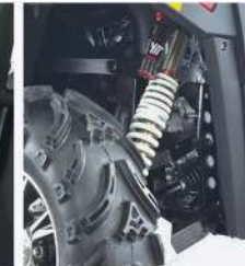
GAS ASSISTED SHOCKS