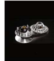
CVT TECH TRAILBLOC